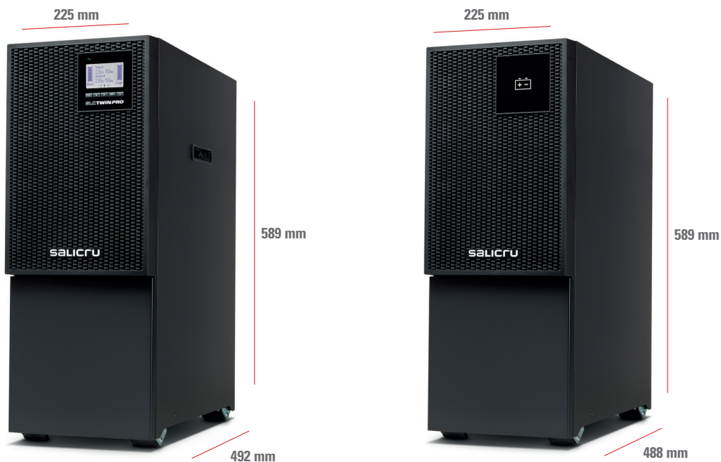
SLC 4000÷10000 TWIN PRO3