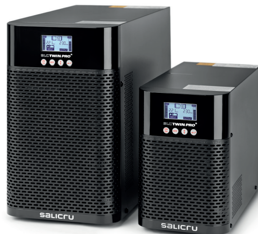
SLC TWIN PRO2