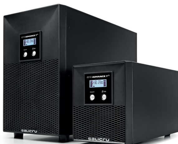
SPS ADVANCE T