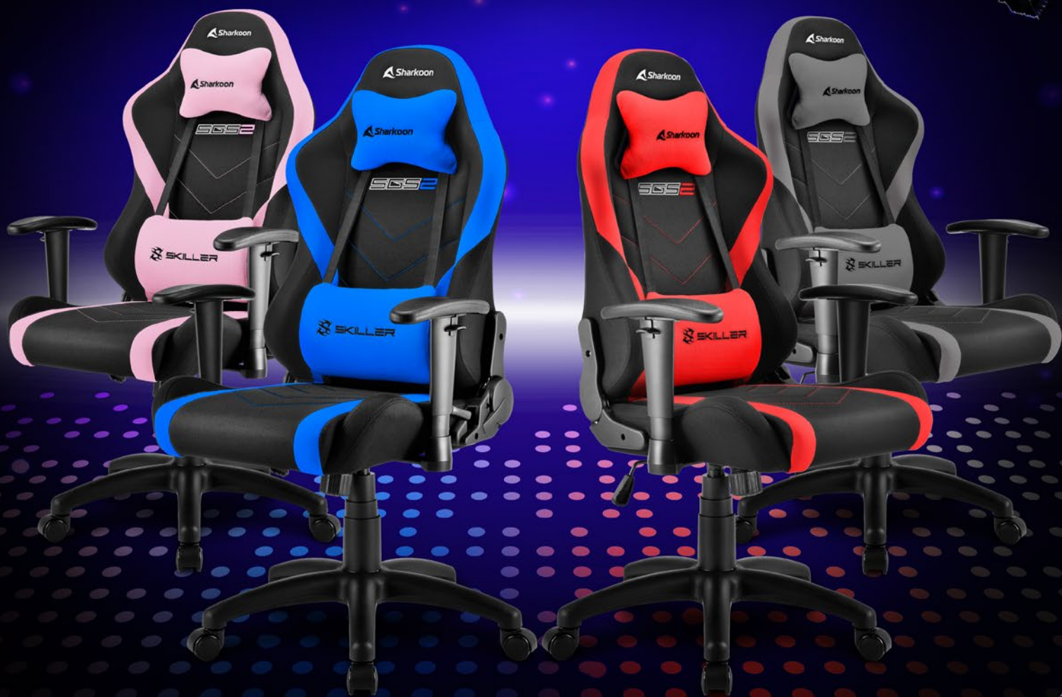
SKILLER SGS2 Jr. Blue