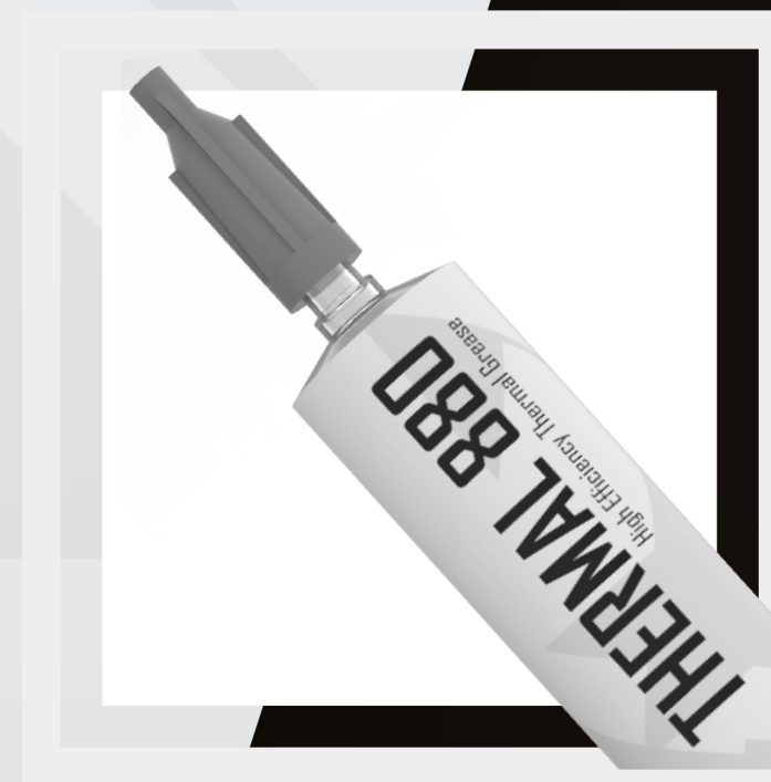
APLICADOR DE PRECISIÓN APLICA PASTA CON PRECISIÓN SIN DERRAMAR