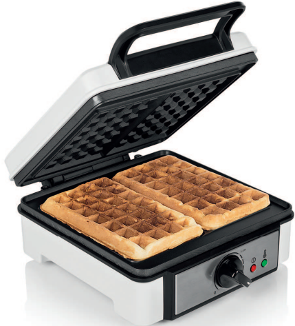
Waffle iron 01.132397.01.001

PARTS DESCRIPTION / ONDERDELENBESCHRIJVING / DESCRIPTION DES PIÈCES / TEILEBESCHREIBUNG / DESCRIPCIÓN DE LAS PIEZAS / DESCRIÇÃO DOS COMPONENTES / DESCRIZIONE DELLE PARTI / BESKRIVNING AV DELAR / OPIS CZĘŚCI / POPIS SOUČÁSTÍ / POPIS SUČASTI / ОПИСАНИЕ ЗАПЧАСТІ