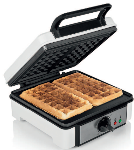
Waffle iron 01.132397.01.001

PARTS DESCRIPTION / ONDERDELENBESCHRIJVING / DESCRIPTION DES PIÈCES / TEILEBESCHREIBUNG / DESCRIPCIÓN DE LAS PIEZAS / DESCRIÇÃO DOS COMPONENTES / DESCRIZIONE DELLE PARTI / BESKRIVNING AV DELAR / OPIS CZĘŚCI / POPIS SOUČÁSTÍ / POPIS SUČASTÍ / ОПИСАНИЕ ЗАПЧАСТИ